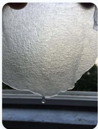
材质细腻， 亲肤透气