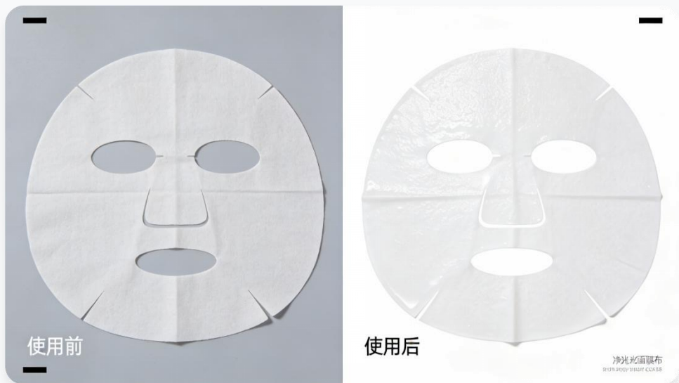
白变透材质工艺：使用前对比