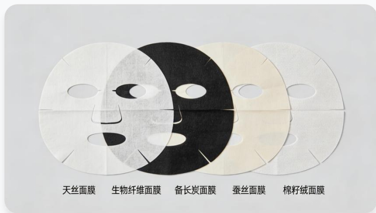
多材质面膜布组合展示